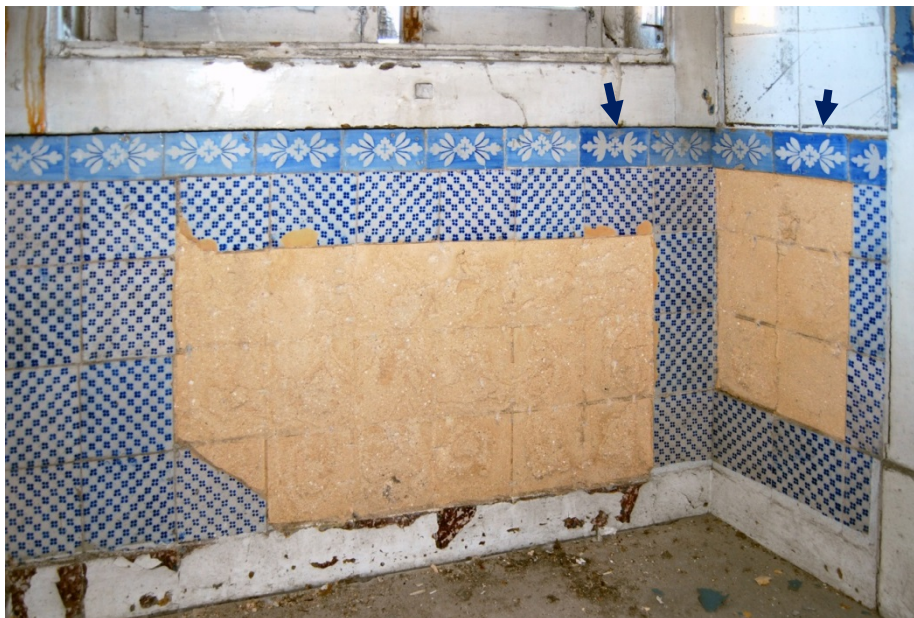
Figura 4- Padrão de pequenas flores azuis usado no Beau Séjour e em outros edifícios desde, pelo menos, o início da década de 1850. Neste caso os azulejos de fachada não parecem defeituosos, mas os do friso, um padrão muito utilizado pela Fábrica Roseira, sim: o azul de cobalto tem um tom demasiado claro ou a decoração incompleta (como ocorre com aqueles que surgem sinalizados na imagem).