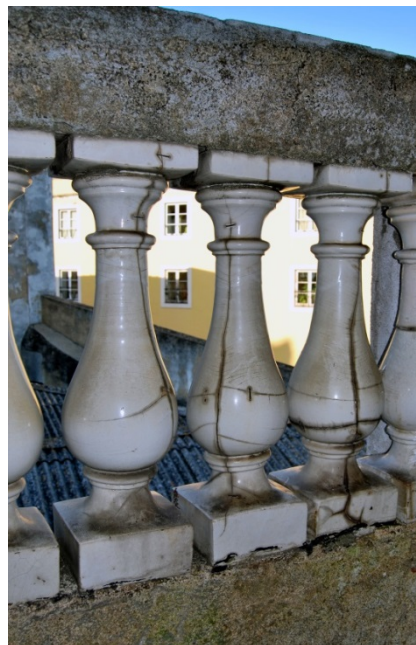
Figura 2- Balaústres cerâmicos colocados no remate da fachada da “Casa das Bolas” e onde são visíveis as inúmeras fracturas e gatos que indiciam o seu reaproveitamento

Os balaústres são, como se reconhece, reaproveitamento de refugo da fábrica ou, talvez dessa pré-existência, recuperado com gatos, e isto apesar, frise-se, do facto de o edifício pertencer ao irmão do dono da fábrica, que a viria a dirigir alguns anos mais tarde, entre 1885 e 1895, conforme investigação de Luisa Arruda [ 3 ]. De acordo com Charles Lepierre a produção de azulejos e balaústres na fábrica ter-se-á iniciado cerca de 1840 [ 4 ].